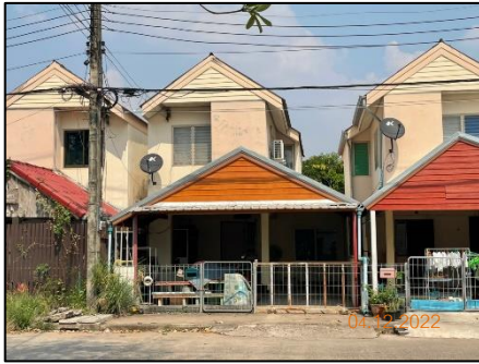
ลักษณะบ้านพักอาศัย