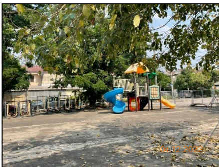
พื้นที่สีเขียวและสวนสาธารณะ