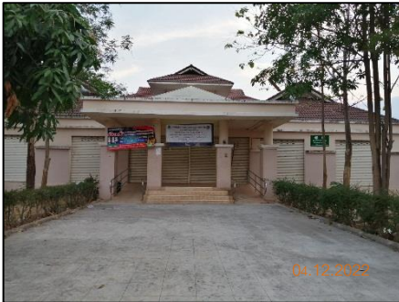
อาคารศูนย์ชุมชน