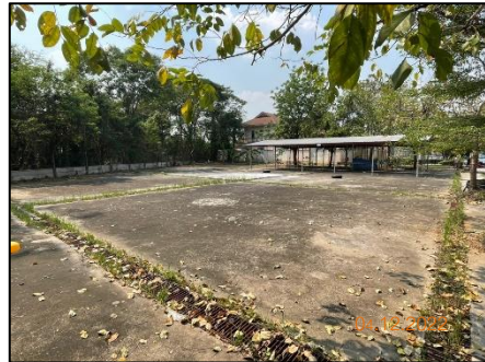
ลานร้านค้าชุมชน