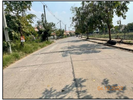
ถนนภายในโครงการ