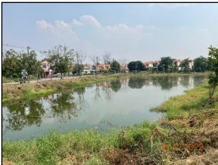
พื้นที่สำหรับบ่อหนองน้ำ