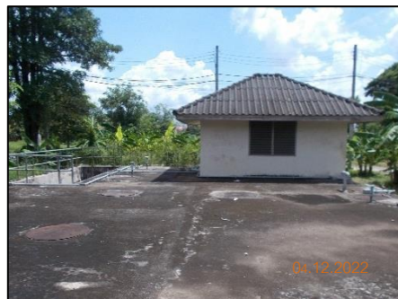
ระบบบำบัดน้ำเสีย